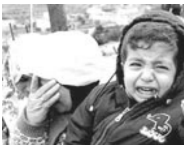
Gerade wurde ihr Haus zerstört...

Bevölkerung aus der Westbank nach Jordanien vertrieben werden. Die ohnehin schon zahlreichen illegalen, israelischen Siedlungen könnten ausgebaut werden und einer totalen Annektierung der Westbank würde nichts mehr im Wege stehen. Der Gazastreifen als palästinensische 'Minienklave' wäre leicht zu kontrollieren und wirtschaftlich vollständig abhängig von Israel zu halten.